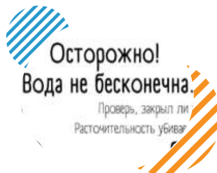
Со.pilka г. Пермь