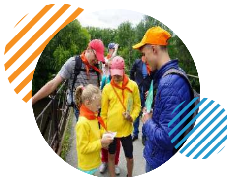
Мосты Тагила Нижний Тагил

Ежегодно реализуемых социальных проектов участниками конкурса