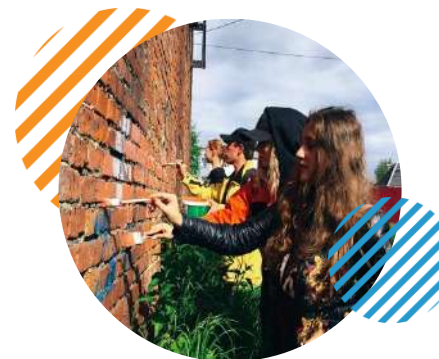
Цветущий город Качканар