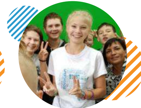
Медиаclub «CommUNITY» п. Ува