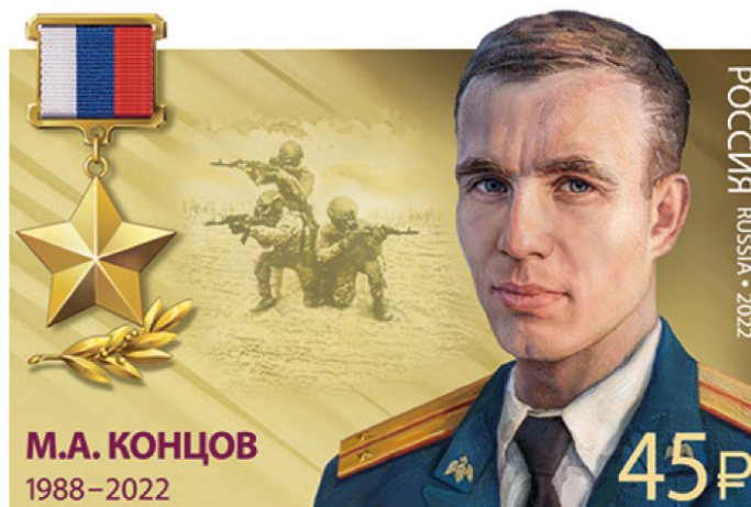
Памятная марка «Почта России», выпущенная в честь Героя России М.А. Концова

Максим Андреевич Концов - офицер 21-го отряда специального назначения «Тайфун» Федеральной службы войск национальной гвардии Российской Федерации, лейтенант. Участник СВО на Украине.